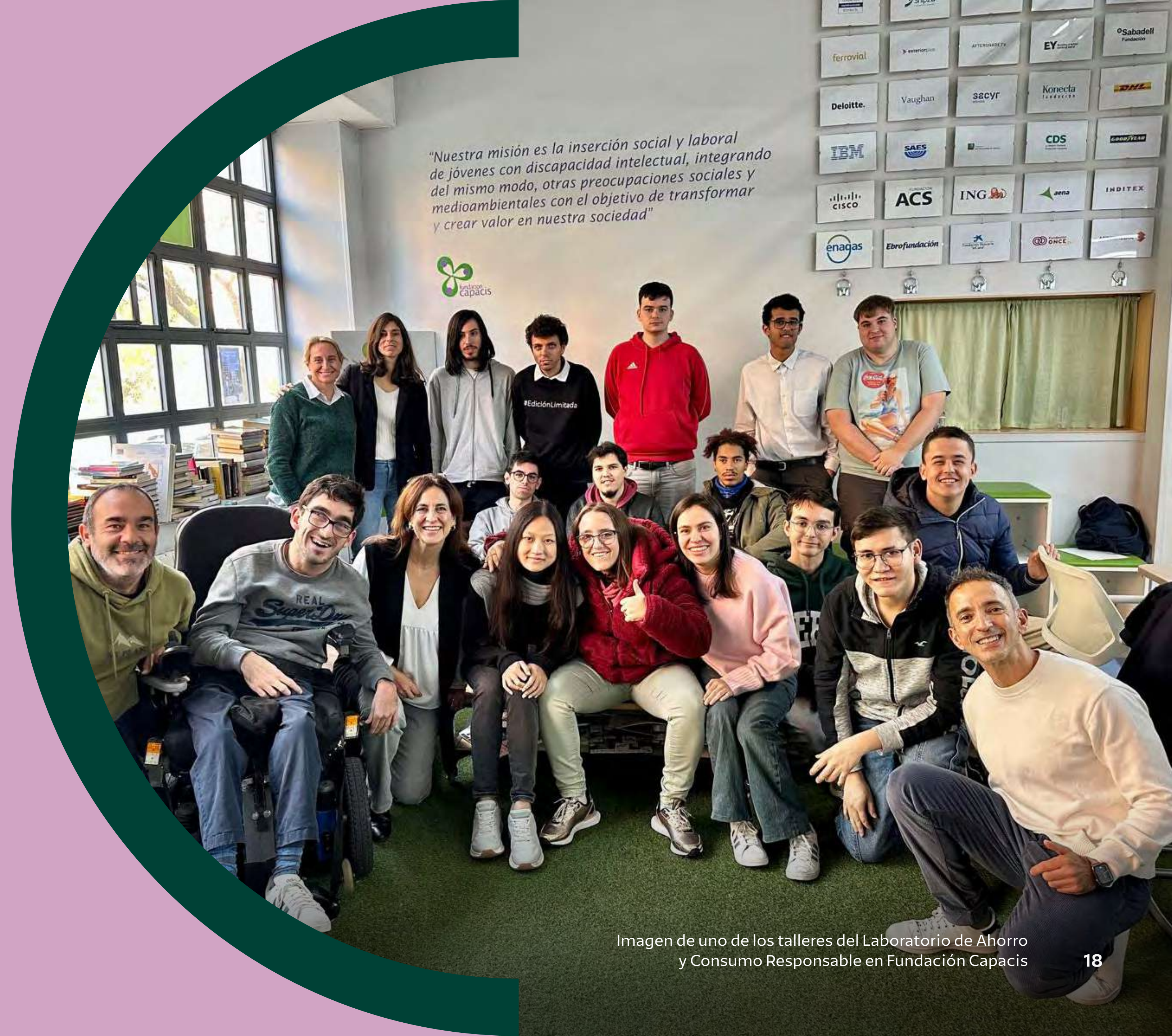
Imagen de uno de los talleres del Laboratorio de Ahorro y Consumo Responsable en Fundación Capacis

Entre los proyectos más relevantes destaca el Laboratorio del Ahorro y Consumo Responsable , activo desde 2020, dirigido a población infantojuvenil y, desde 2022, a personas con discapacidad e inteligencia límite. En 2025, este programa ha beneficiado a 1.400 niños, niñas y adolescentes y a 65 personas con discapacidad, ampliando su impacto gracias a acuerdos con entidades especializadas.