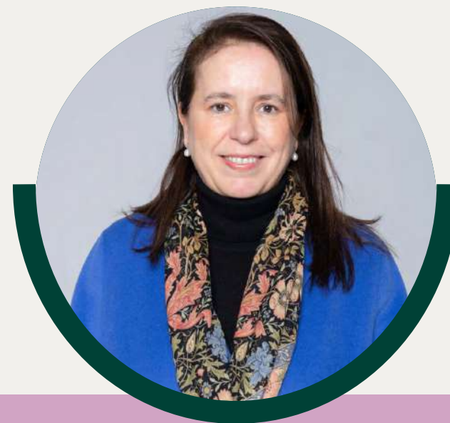
Urquiola de Palacio del Valle de Lersundi Patrona