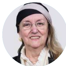
Amelia Valcárcel Catedrática de filosofía moral y política en UNED y consejera de Estado.