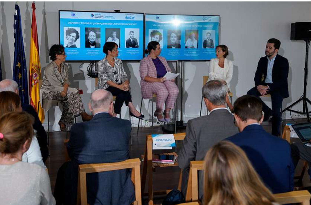
Conocimiento de los vehículos de ahorro

El objetivo de esta investigación ha sido analizar en profundidad el panorama de la educación financiera de los jóvenes en España nacidos entre la década de 1980 y los 2000 . Entre sus conclusiones destaca que los/las jóvenes de estas edades tienen menor conocimiento sobre educación financiera que otros grupos de edad, especialmente cuando se trata de vehículos de inversión. Sin embargo, conocen más los vehículos que presentan un mayor riesgo, como las criptomonedas y las acciones.